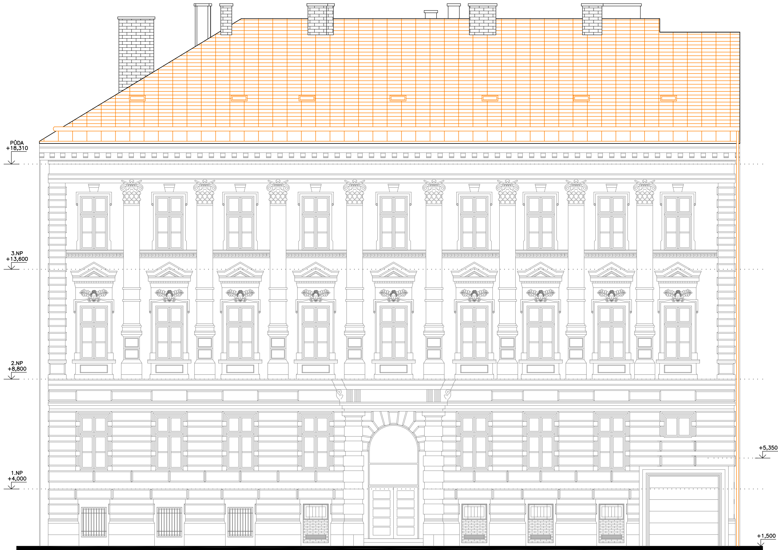
POHLED ULIČNÍ SEVEROVÝCHODNÍ - BOURACÍ PRÁCE